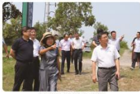
省农业局领导来公司视察