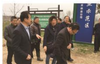
陕西省咸阳市林业局局长来公司考察