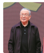
安徽省人大常委会副主任吴天炼在分会成立大会上发表重要讲话