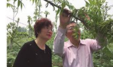
黄教授亲临现场指导