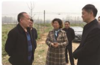
市林业局局长及县林业局局长来公司指导