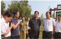
中国林业产业联合会副会长兼秘书长王满来公司考察