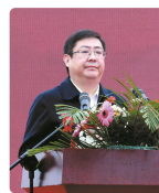
中共全椒县委书记朱大纲在分会成立大会上致贺词