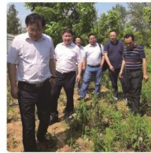
著名企业怡和集团来公司洽谈业务