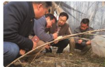
市林业局领导来公司考察菌棚情况